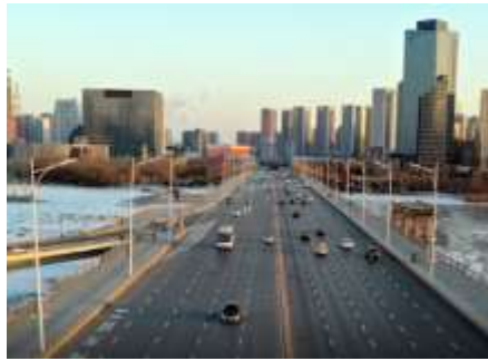
UNE VUE DE PÉKIN EN TEMPS NORMAL (hiver 2015).

Mais ce que je peux vous dire, qu'en Chine le ciel s'est éclairci